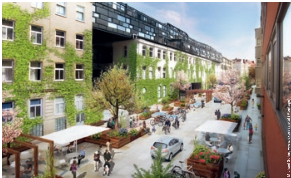
Michael Sohm, www.expressiv.at (Montage)